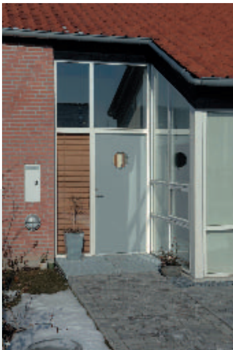
Niveaufri adgang via rampe med repos

En sådan traditionel sokkelløsning med en rampe og et repos hævet 15 - 30 cm over terræn er en sikker og velafprøvet konstruktion.