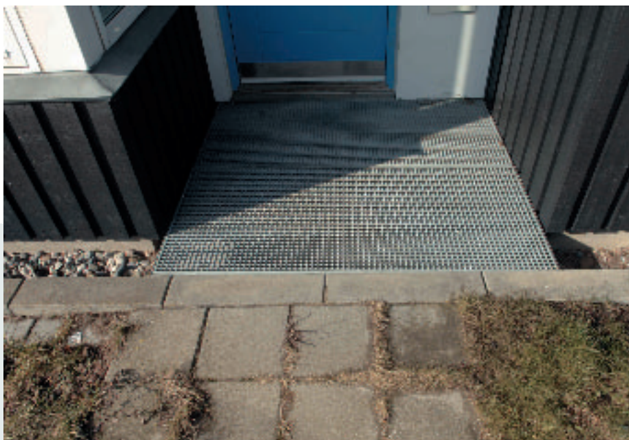
Niveaufri adgang med rist over voldgrav

For begge løsninger gælder, at der i langt de fleste tilfælde bør anlægges omfangsdræn. Kun i de tilfælde, hvor en jordbundsanalyse kan dokumentere, at jorden er veldrænende, kan omfangsdræn undlades. Byggeriet og byggepladsen bør planlæg-